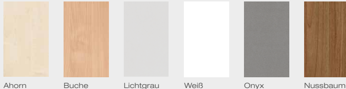
Ahorn Buche Lichtgrau Weiß Onyx Nussbaum